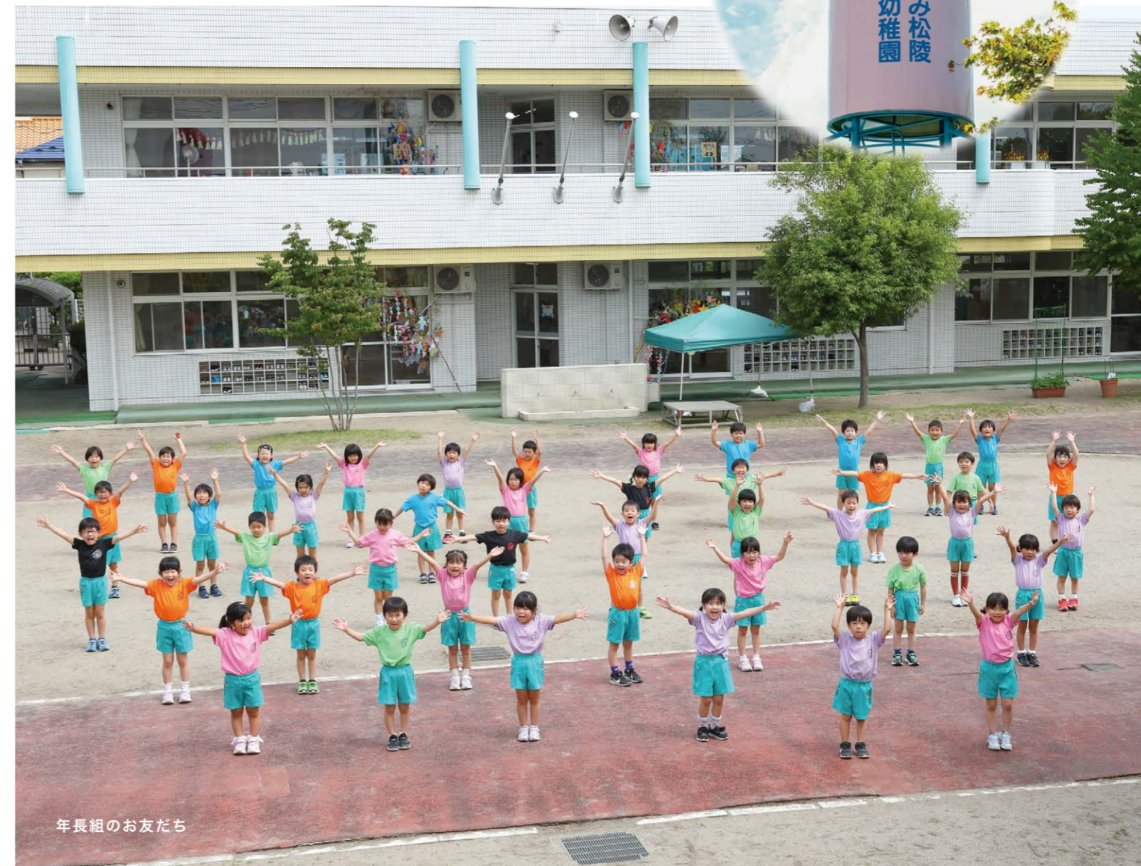
年長組のお友だち